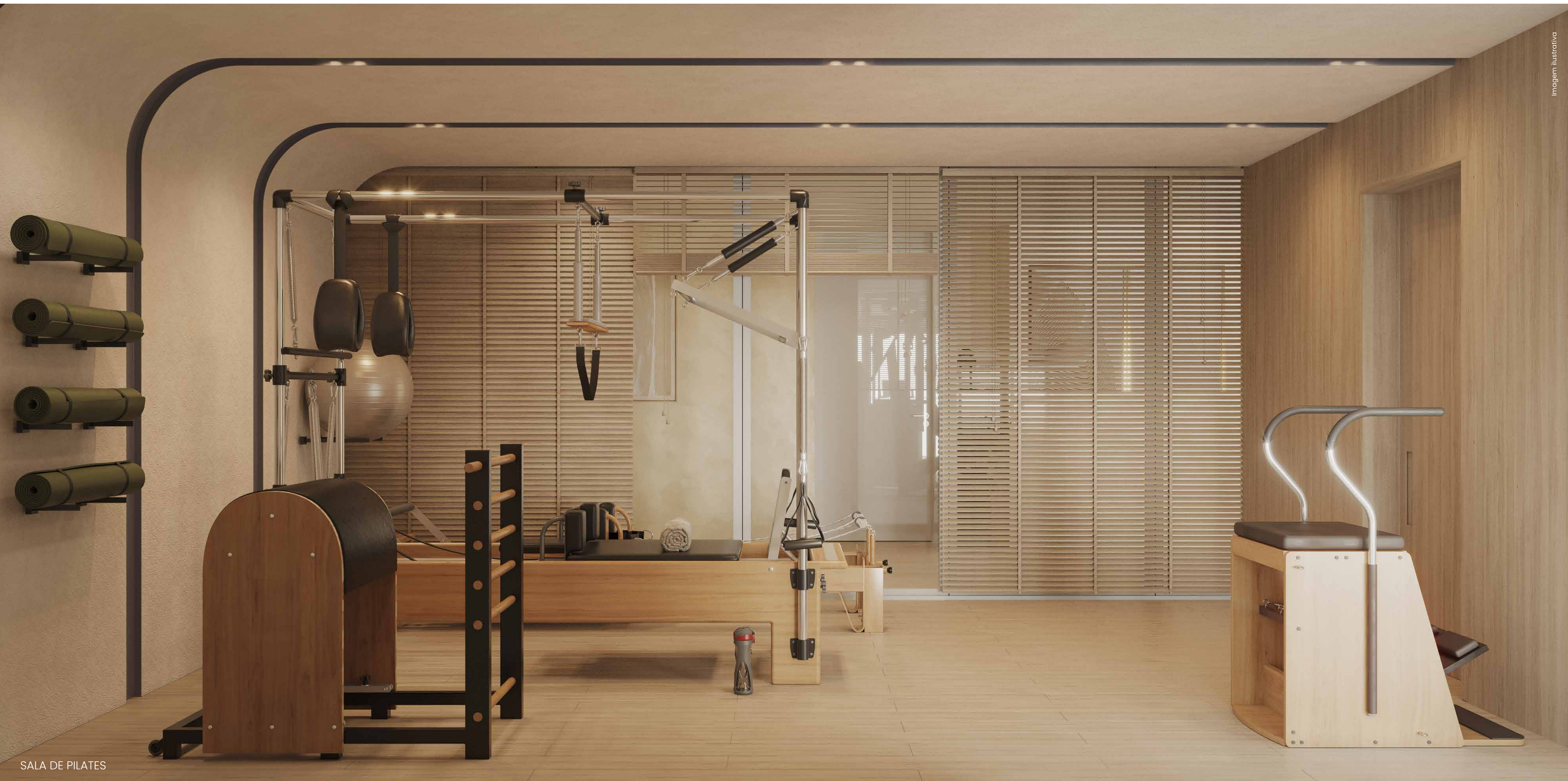
SALA DE PILATES